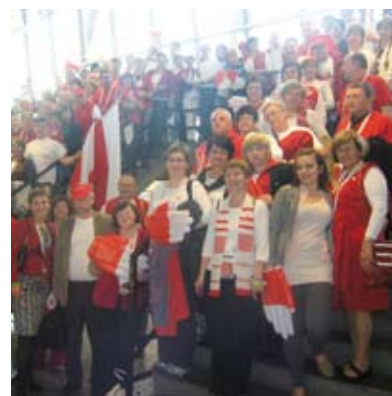
Światowy i Europejski Zjazd