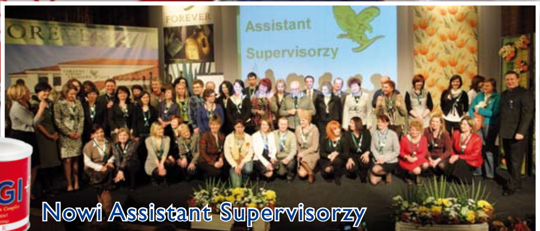
Nowi Assistant Supervisorzy