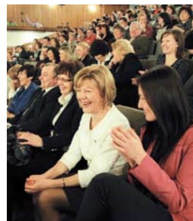
Success Day Warszawa