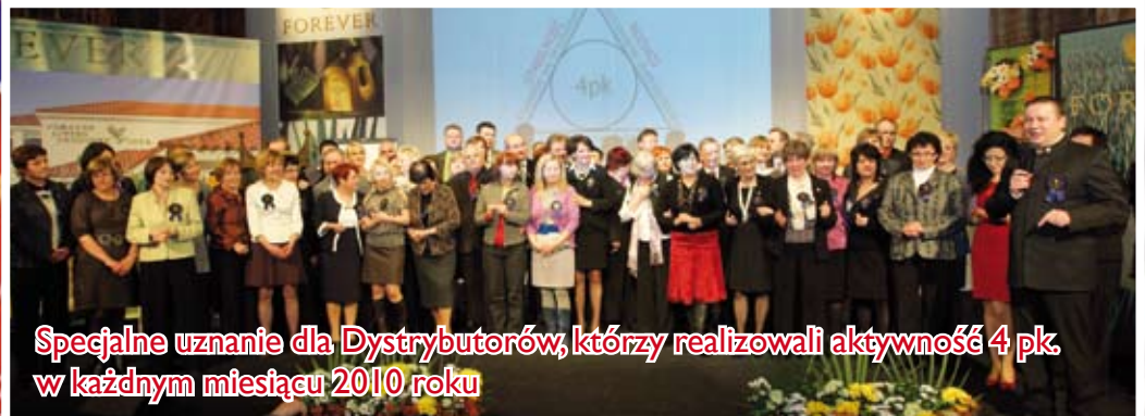
Specjalne uznanie dla Dystrybutorów, którzy realizowali aktywność 4 pk w każdym miesiącu 2010 roku