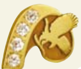
Diamond Centurion 100 Managerów