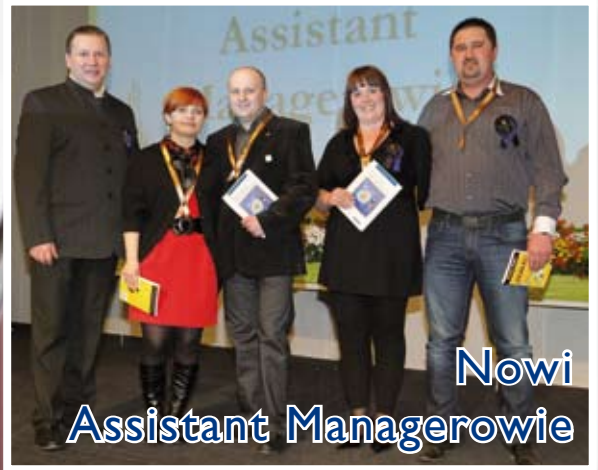
Nowi Assistant Managerowie