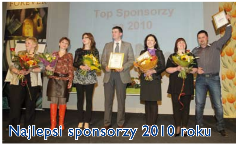
Najlepsi sponsorzy 2010 roku